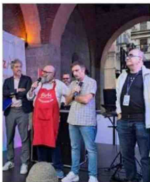
Elio, i vip e Acampora a Monza

MONZA (cdi) Un evento sensazionale, come lo ha definito il frontman di Elio e le Storie tese. Per la prima volta al mondo i ragazzi autistici si sono occupati di food and beverage di un concerto. Monza è stata per un weekend capitale dell'inclusione in occasione del Concertozzo, con il coinvolgimento di PizzAut e tanti convegni sotto l'Arengario.