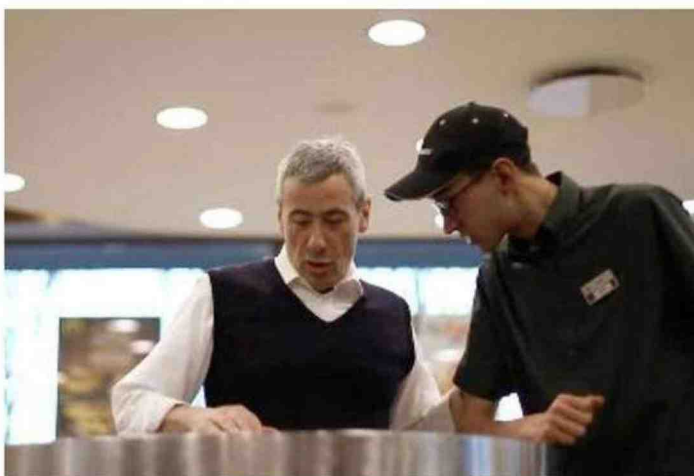
In cinque anni di attività una trentina le persone assunte a tempo indeterminato