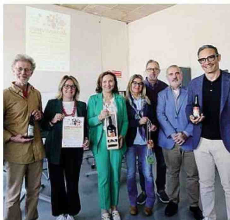
La presentazione del progetto e al centro la birra di Novo Millennio, infine il centro sportivo di via Rosmini, dove si tiene nel fine settimana la prima edizione di Convivialità festival