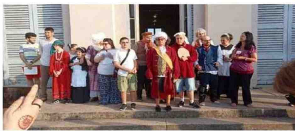
I ragazzi del Tiki Taka nella veste di guide a Villa Tittoni e barman a Parco Tittoni estate