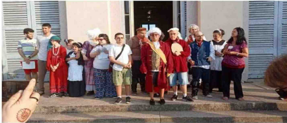
I ragazzi del Tiki Taka nella veste di guide a Villa Tittoni e barman a Parco Tittoni estate