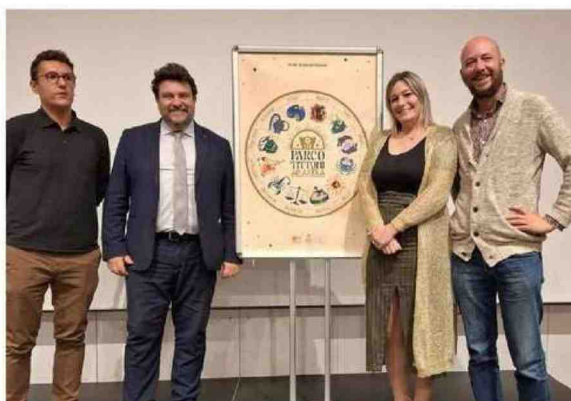
La presentazione nello Spazio Stendhal in Villa Tittoni della stagione estiva promossa da Mondovisione