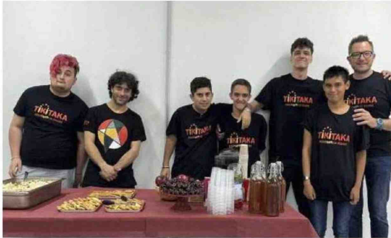
Alcuni ragazzi della brigata del progetto Tikicatering. Prima di andare in sala seguono percorsi di formazione

È necessario arrivare al riconoscimento che ogni persona può dare il proprio contributo alla società. Le persone diversamente abili possono essere un valore significativo anche in ambito produttivo. Le nostre organizzazioni hanno raggiunto più di 1.500 persone. Nell’abitare siamo riusciti a dare alloggio a 300 persone e nel lavoro in 4 anni siamo arrivati a 26 assunzioni. Il nostro primo impegno è promuovere la cultura dell’inclusione»