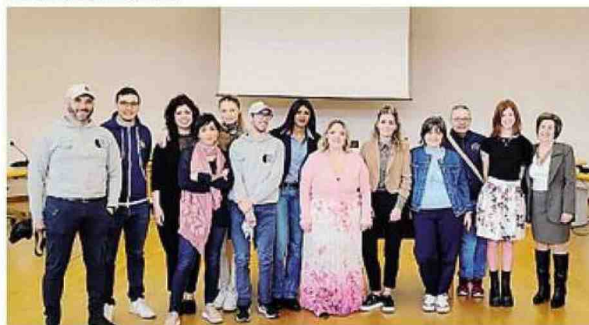
Alcuni dei partecipanti al convegno sull'autismo