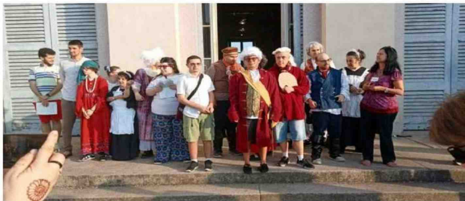
I ragazzi del Tiki Taka nella veste di guide a Villa Tittoni e barman a Parco Tittoni estate