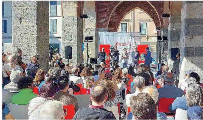
A Monza un momento del "Concertozzo" di Elio e le Storie Tese