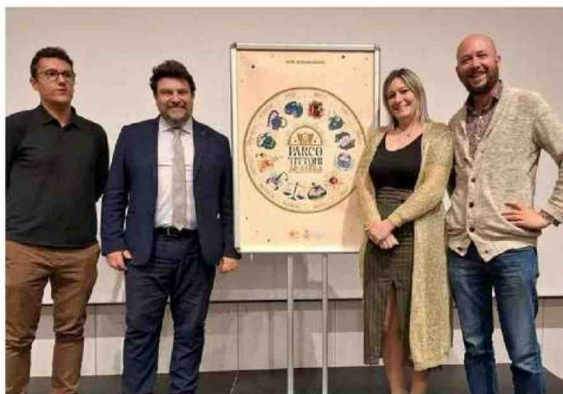
La presenta- zione nello Spazio Sten- dhal in Villa Tittoni della stagione estiva pro- mossa da Mondovisio- ne