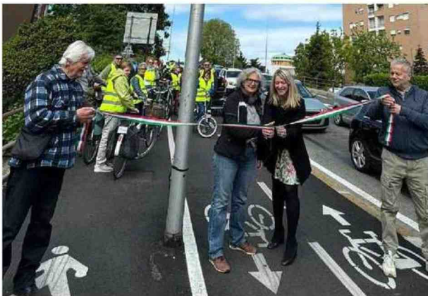
L'inaugurazione della ciclabile di via Aquileia

pletivo di circa 150.000 euro percorre il tratto compreso tra via Paisiello e via Borgazzi, sul lato dei civici pari. È lunga 300 metri e collega due tratti già realizzati in precedenza, continuando su via Montesanto per poi congiungersi con via Borgazzi e viale Campania».