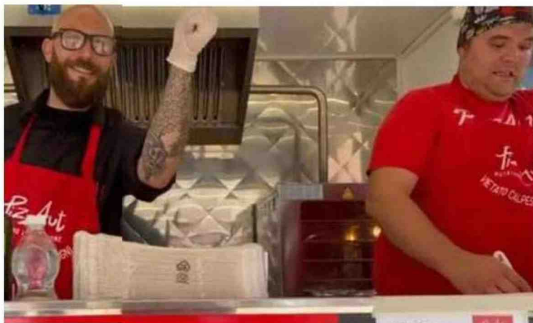
Sopra il Trio Medusa nelle cucine di PizzAut a Monza A sinistra i dj speciali all'Arengario e il food truck in piazza Roma Oggi PizzAut sarà al Concertozzo con altre onlus