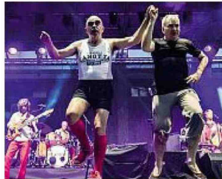
Un «balletto» di Elio durante il precedente Concertozzo: appuntamento a Monza per il 26 maggio