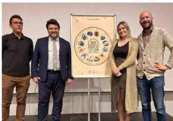
La presentazione nello Spazio Stendhal in Villa Tittoni della stagione estiva promossa da Mondovisione